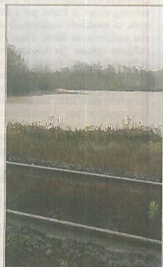
Sotto minaccia Campi allagati dall'Orba vicino alla linea ferroviaria