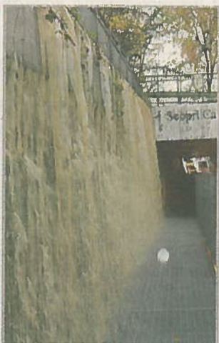
Cascata L'acqua ha invaso a Casale il sottopasso del Valentino e la zona dell'ospedale

Situazione d'emergenza anche a Casale e in diversi punti del Monferrato casalese per le piogge torrenziali delle ultime ore. Nel mitrino ancora una volta il torrente Gattola. Alle 15,45 di ieri è stata decisa la chiusura del sottopasso del Valentino con una vera cascata che si riversava nel lato verso San Germano. Strade allagate in zona Ospedale con fossi e rigagnoli intasati dall'acqua che continua a scendere dalla collina di San Giorgio. Chiusa la strada che porta alla camera mortuaria ed è stato necessario allestire una sorta di passerella di legno all'ingresso pedonale della sede della Croce rossa. Chiusa per la presenza di oltre 50 centimetri d'acqua la Casale-Alessandria dalla Pastorfrigor al bar di San Germano e chiusa