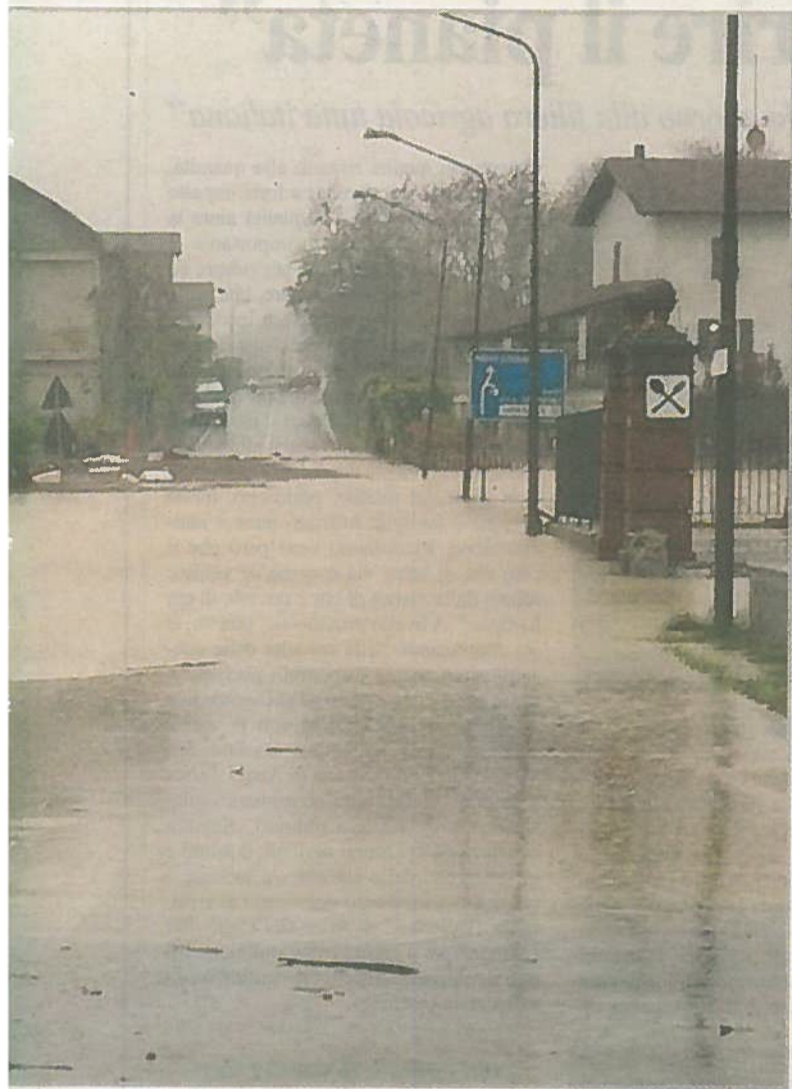
L'Orba a Capriata ha allagato anche la provinciale Ovada-Novi